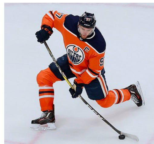
Grâce à un McDavid en feu, Edmonton a battu Chicago. -AFP

NHL En dominant les Blackhawks (sans Kurashev) 6-3 dans la nuit de lundi à mardi, Edmonton (sans Haas) a égalisé à 1-1 dans sa série de pré-play-off au meilleur des cinq matches face à Chicago. Les Oilers doivent une fière chandelle à Connor McDavid, auteur d'un hat-trick. Après avoir allumé la lampe à la 19e seconde, le premier choix de la draft 2015 a concocté un chef-d'œuvre quatre minutes plus tard. Alors que les joueurs de la Ville des vents étaient revenus à 3-3, «McJesus» a inscrit le 4-3 peu avant le terme de la période médiane, un goal qui s'est révélé décisif. À Toronto, les Pittsburgh Penguins ont nivelé la série contre le Canadien de Montréal (1-1) grâce à une victoire 3-1 qui porte la griffe de Sidney Crosby, auteur de l'ouverture du score d'un tir du poignet. -EMF