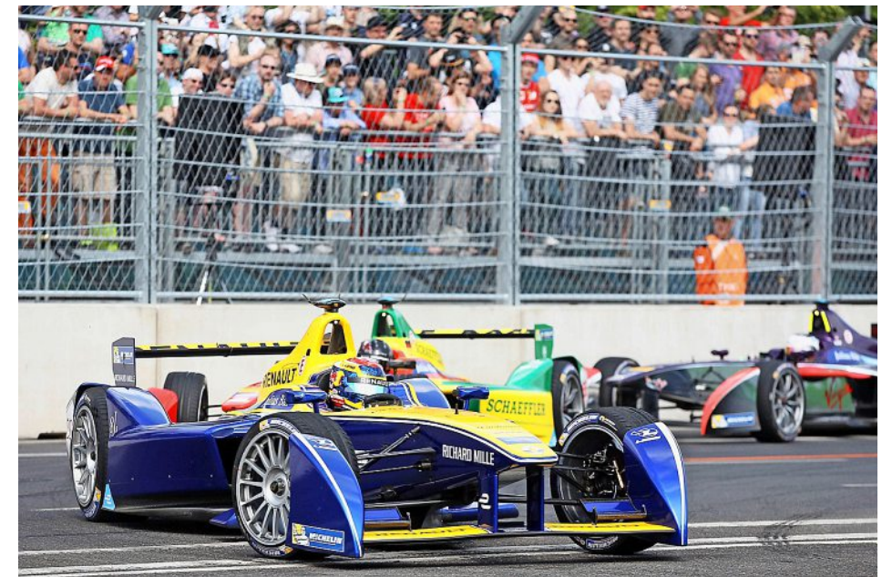
Le Vaudois s'était imposé en 2016 dans la capitale allemande. Et il avait récidivé l'année suivante.

AUTOMOBILISME La saison de Formule E reprend à Berlin ce soir. Le pilote vaudois espère rattraper son retard sur le leader.